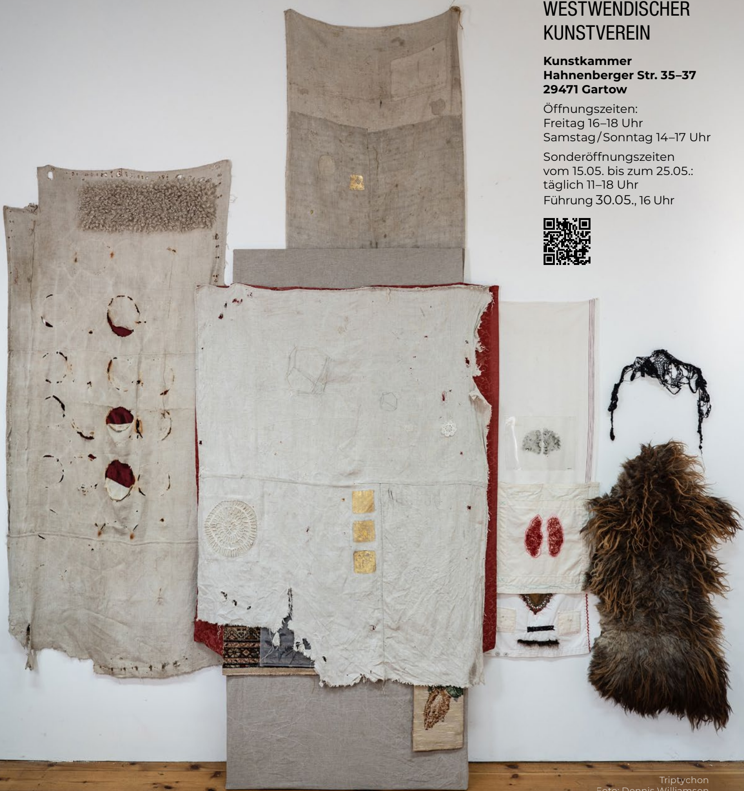
Triptychon